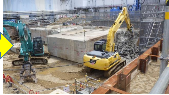
(写真 1 - 2) 今回の状況 (令和3年7月12日撮影)