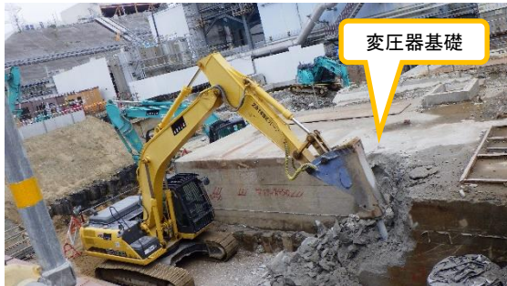
(写真 2 - 2) 地下埋設物 (変圧器基礎) の 撤去状況