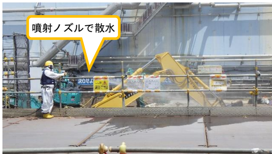
(写真 2 - 1) 散水の状況