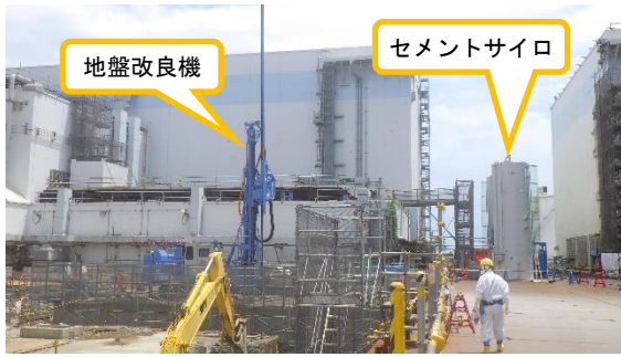
(写真3) 地盤改良準備工事機材の搬入状況