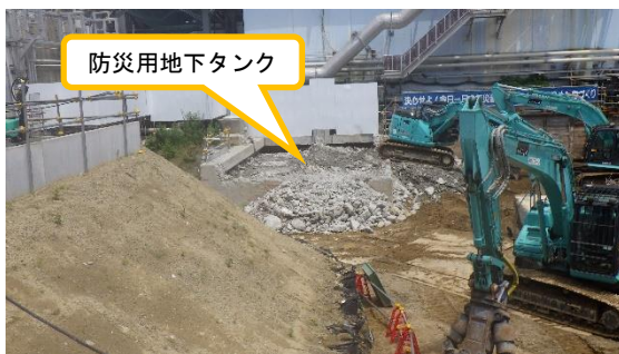
(写真 2 - 3) 地下埋設物 (防災用地下タンク) の 撤去状況