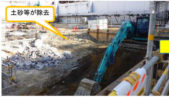
(写真 1 - 1) 前回の状況 (令和3年1月21日撮影)