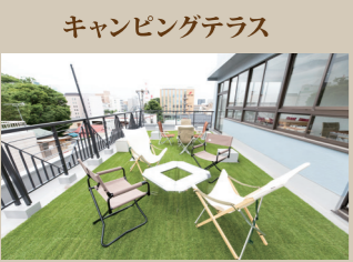
Blue Bird apartment. 4階にあるイベントスペース。「Snow Peak Business Solutions」とタイアップしており、備え付けのSnow Peakのギアやキッチンを活用しながらワークショップやセミナーなどを行える。レンタル料金などは公式ホームページ参照。