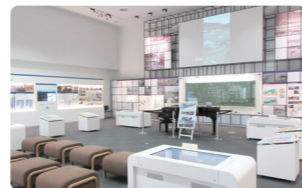
パネルや映像を見ることができる展示室。資料は自由に撮影することができます。