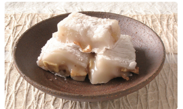
山内果樹園で栽培したふじりんごを加工した商品。砂糖や添加物を使わず、噛めば噛むほどりんご本来の味が楽しめます。紅茶やヨーグルトなどに合わせても美味。

電子レンジ調理で簡単にできる和菓子です。ゆべしのモチリ感と、りんごどくるみの食感が良いアクセントになります。お好みで、はちみつとシナモンをかけても◎! おうち時間にオススメの一品です。