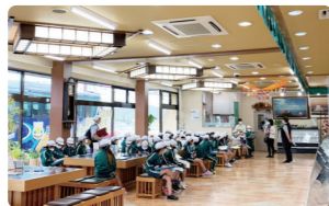
専門のガイドが付くツアーに申し込むことも可能です。

かねまん本舗 鮮度にこだわり、創業当時から直売の販売形式を続けています。直売所のすぐ近くに工場があるので、できたてを試食することができます。 問 かねまん本舗 0120-17-3360 所 いわき市平下高久字下原83 かねまん本舗 検索