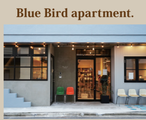
Blue Bird apartment. 築45年の美容室を改修してできた複合施設。1階はカフェ、2階はデザイン事務所、3階はシェアオフィス、4階はイベントスペースになっている。福島県郡山市清水台1-8-15