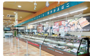
ショーケースには、趣向を凝らした多種多様な商品がズラリと並びます。