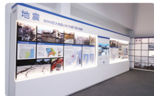
発災から復旧・復興までの道のりを、テーマごとに時系列で展示しています。