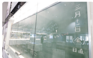
卒業式に被災した「旧いわき市立豊間中学校」の黒板。寄せ書きが残されています。

いわき震災伝承みらい館 震災に関する資料展示のほか、震災語り部による定期講話も行っていきます。一般の見学のほか、団体による視察も受け付けています。 問 いわき震災伝承みらい館 0246-38-4894 所 いわき市薄磯3丁目11 いわき震災伝承みらい館 検索