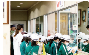
実際の製造過程をガラス越しに見学できます。