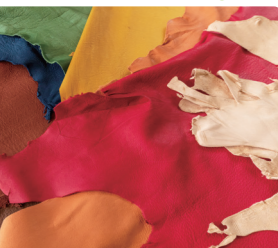
鹿の革は吸水性が良く、丈夫で柔らかいため、身に着けるものに最適なのだとか。