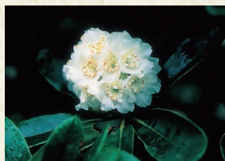
県の花：ネモトジャクナゲ